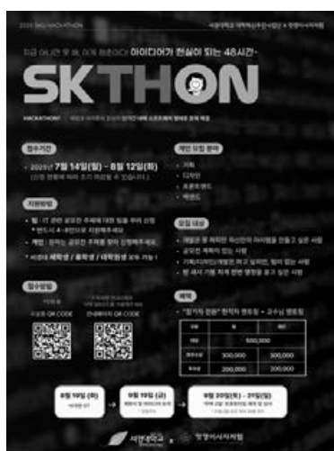
▲ 출처 : 서경대학교 홍보실