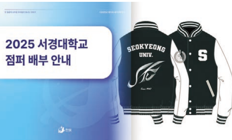
▲ 출처 : 총학생회 인스타그램

수령 대상은 점퍼 구매 사전 신청 및 결제까지 완료한 사람이다. 신분증 지참 후 서경포탈 메인화면을 인증하면 받을 수 있다. 본인 외 대리수령은 불가하며, 수령 기간 후에는