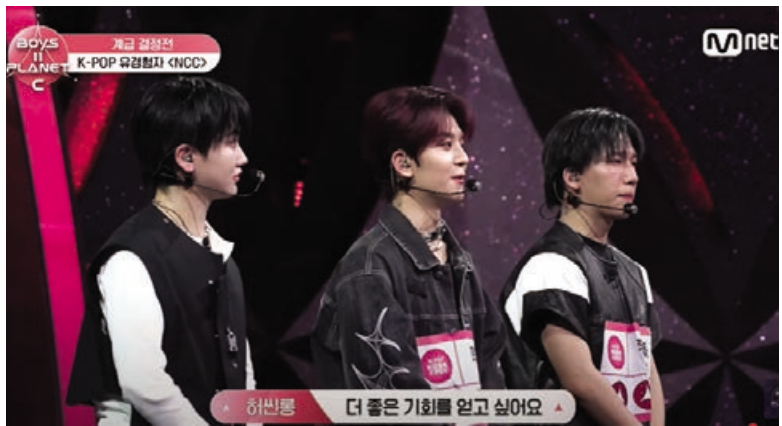
▲ 출처 : Mnet

서경대 언어문화교육원 홍보대사 보이스토리, <보이즈 2 플래닛>에서의 성장과 도전