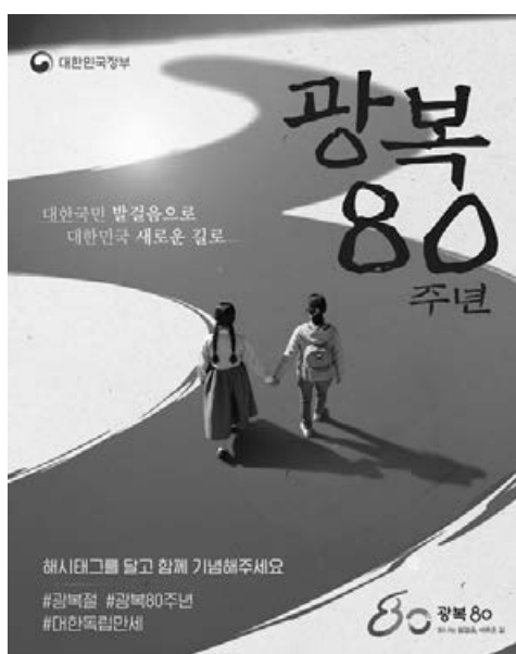
▲ 출처 : 대한민국 정책브리핑

2025년 8월 15일, 대한민국은 광복 80주년의 아침을 맞았다. 순국선열들의 숭고한 희생을 기리는 엄숙함과 미래를 향한 축제의 에너지가 교차하는 가운데, 이번 광복절은 단순한 역사적 기념일을 넘어 화합과 발전을 위한 국가적 노력의 장이었다. 정부는 광복 80주년을 맞아 행정안전부 주관으로 8월 15일 제80주년 광복절 경축식을 개최했다. 80주년 광복절 경축식은 오전 10시 세종문화회관에서 개최됐다. 독립 유공자 유족을 비롯한 각계 주요 인사, 주한외교단, 시민, 학생 등 2,500여 명이 참여해 조국의 독립을 위해 헌신한 선열을 기리고 광복의 기쁨을 나눴다. 경축식은 '함께 찾은 빛, 대한민국을 비추다'를 주제로 진행됐다. 행사는 국민 한 사람 한 사람이 광복의 순간과 오늘날 대한민국을 만든 국