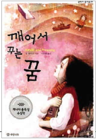
▲ 출처 : 알라딘

“회색이란 무엇일까? 회색은 차가운 비, 따끔따끔한 담요, 단단한 보도, 쓰레기통 속의 들쥐. 회색은 아무 색도 아니다.”