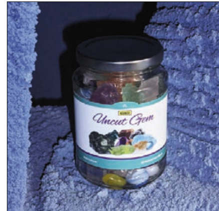
▲ 출처 : 빅스

“Do whatever I want 잔소리 Swing Why you looking so mad? 아 왜 또 이러신대 내 걱정은 No thanks Ooh ooh 이다음 멘트는 알지? Ooh ooh 잘되라고 하는 소리 Sorry mom I don't mind 젓가락질 못 해도 걱정 마 밥만 잘 먹죠”