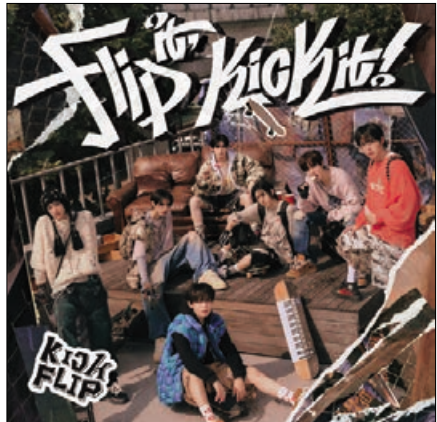
▲ 출처 : 빅스

“내 모험의 첫걸음을 Sparkle sparkle 수수께끼 난 더 알고 싶어 그새 커버넌 걸까 설명할 수 없는데 온 힘을 다해 난 달려 멈춰 서 있고 싶지 않아 이 커다란 Emotion yeah”