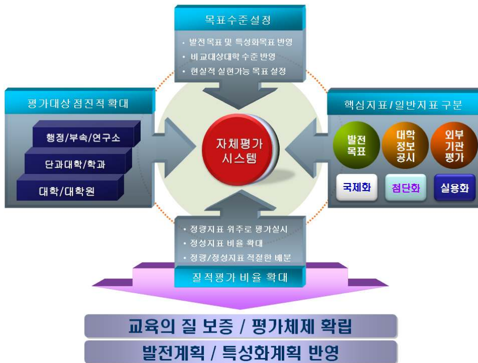
<그림-2> 자체평가 모형